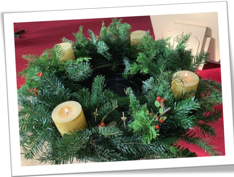
2 e dim. Couronne de l'Avent en l'église Saint-Pierre

Participez à l'« Action d'Avent » de notre Unité pastorale :